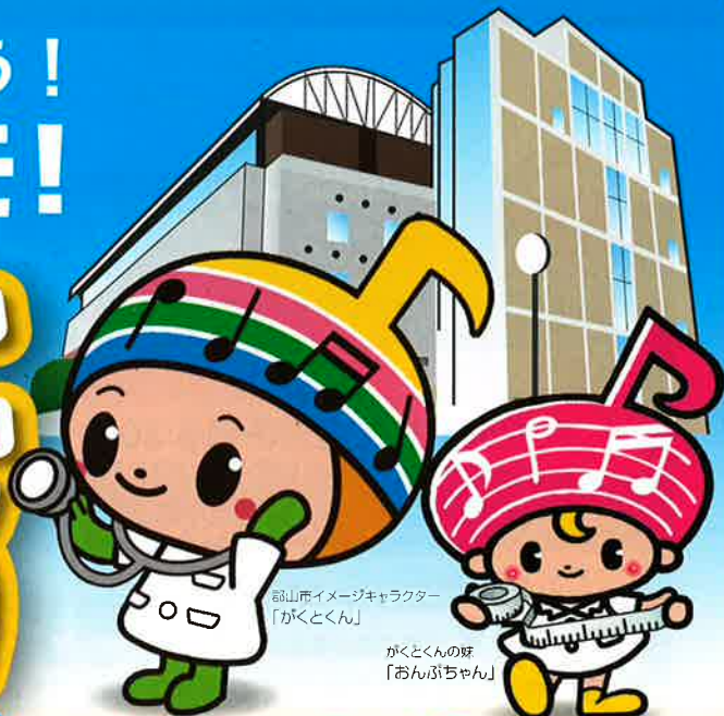
郡山市イメージキャラクター「かくとくん」