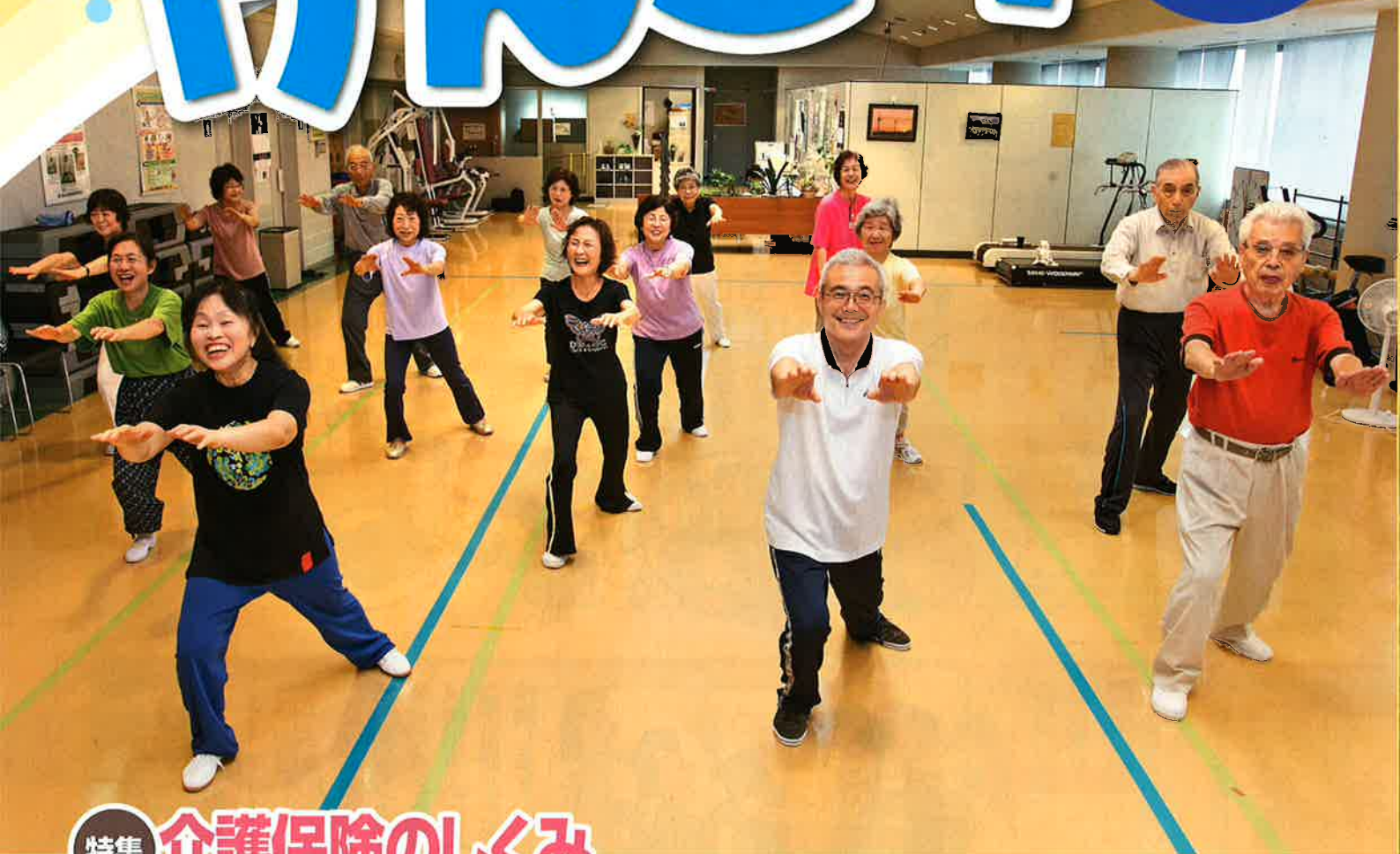
表紙：太極拳風景 当財団で第2・4木曜日の10時から行われている太極拳です。呼吸にあわせてゆっくりと動き足腰を鍛えます。